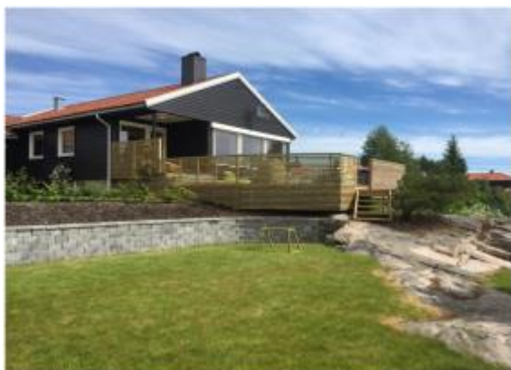
Hagen sett forfra